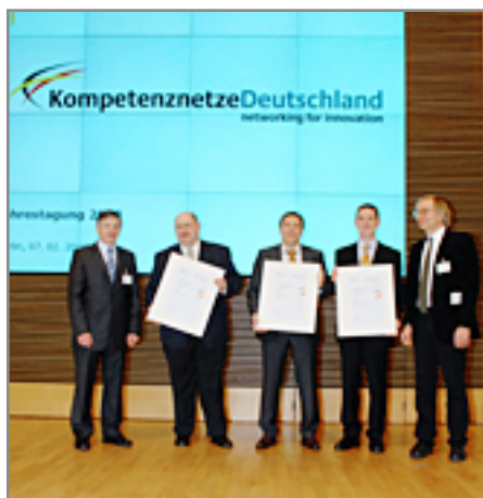
Preisträger des Wettbewerbs "Kompetenznetz 2008"