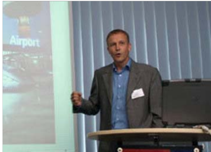
Referent Göbl, SEMIKRON Elektronik GmbH & Co. KG/Nürnberg

Kfz-Innenteile aufzubereiten und nutzbar zu machen.